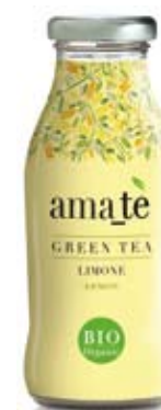
cod. 215V Limone