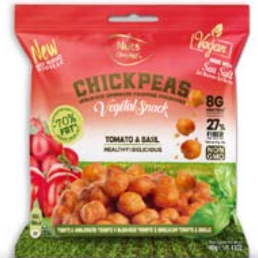
Cod. 301 - POMODORO E BASILICO pack da 40g, box da 15pz

Il cece, coltivato dalla più remota antichità, gioca oggi in modo inedito, anche nel look agile e vivace con i capisaldi della cucina mediterranea: l'olivo, il pomodoro, il basilico, il miele, il formaggio. Croccantezza, valore proteico, sapidità rilevante, gusto artigiano da elegante magione di campagna, perfetto in un roof garden di città.