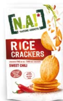
Cod. 220 SWEET CHILI, pack da 70g, box da 12pz

La mixology ha ampliato i suoi confini anche grazie alla hybris salutista di bartender talentuosi: i Mocktail sono freschi cocktail vitaminici a base di frutta e verdura, ideali per bevitori astemi e minorenni, ma anche per quanti, attenti alla salute, apprezzano consumi leggeri. Queste ostie di riso sono per loro: sapidità e fragranza in poche calorie.