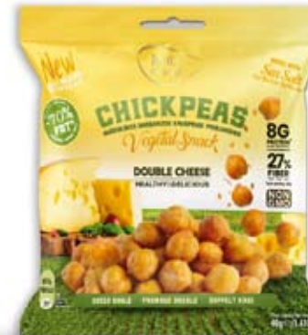
Cod. 299 - FORMAGGIO pack da 40g, box da 15pz