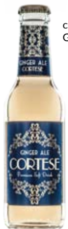
cod. 314 Ginger Ale

La mixology è tecnica, studio, creatività, ma soprattutto selezione delle materie prime. In questa proposta, il meglio del soft drink contemporaneo da un'azienda che fa dell'avanguardia nel biologico una missione.