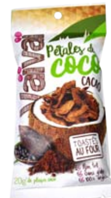
Cod. 280 PETALI DI COCCO TOSTATI AL CACAO busta richiudibile da 20g, box da 24 buste

Il gusto è re, ma l'essenza è regina: è quanto accade con questi curiosi pétales de coco, 100% polpa di frutta che conquistano al primo assaggio per la croccantezza e per la dolcezza non artefatta. Al naturale a colazione, al cacao con il caffè (non per immersione), al curry come aperitivo e sempre come topping su bavaresi e semifreddi. Géniale.