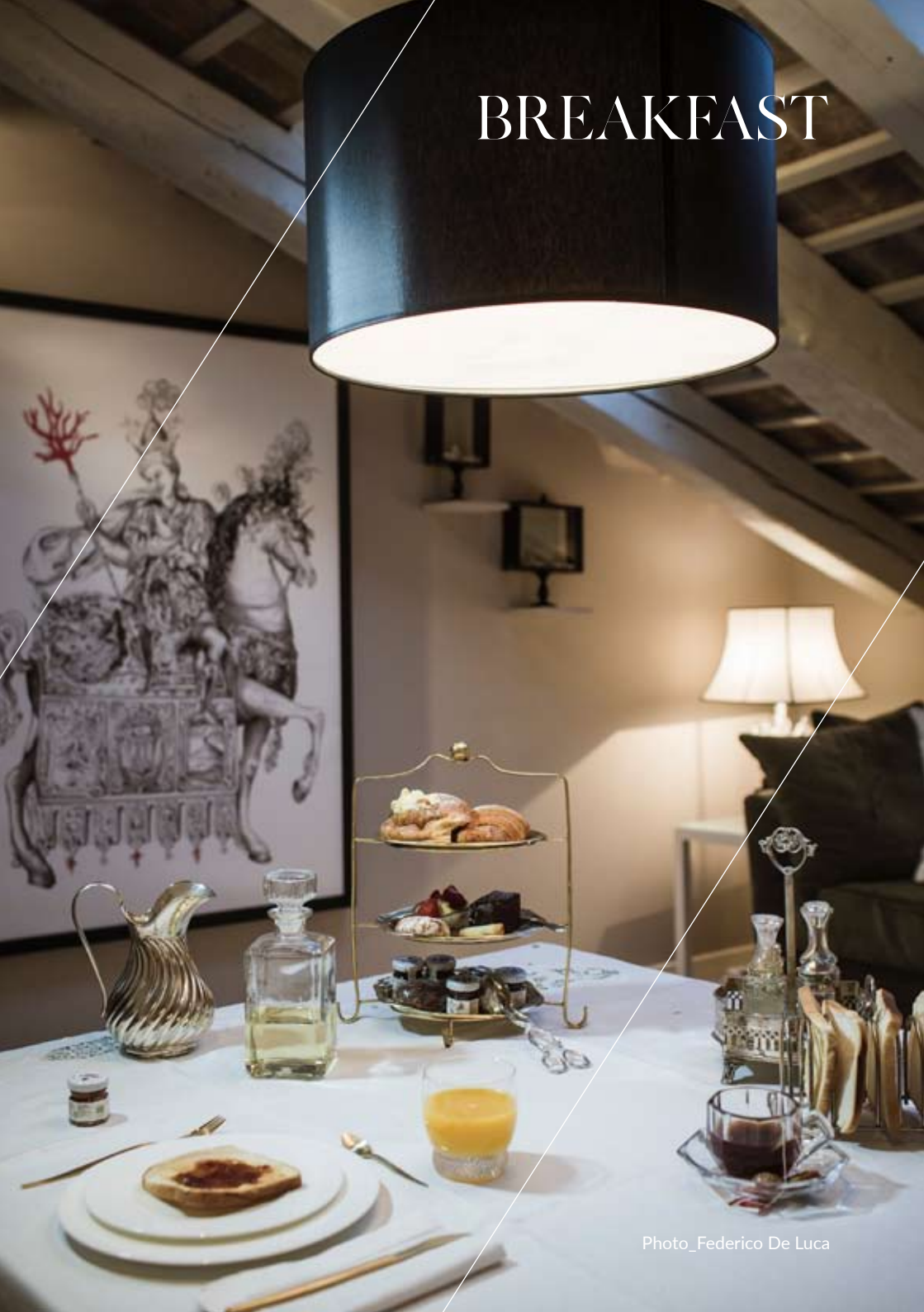
Photo_Federico De Luca