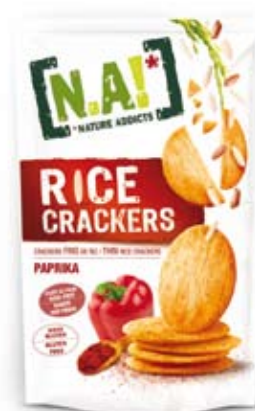
Cod. 222 PAPRIKA, pack da 70g, box da 12pz