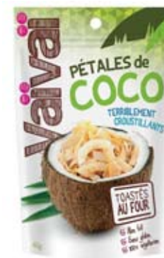
Cod. 257 PETALI DI COCCO TOSTATI AL NATURALE busta richiudibile da 40g, box da 12 buste