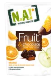
Cod. 205 PEPITE DI ARANCIA AL FONDENTE bustina richiudibile da 35g, box da 30