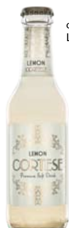
cod. 310 Lemon