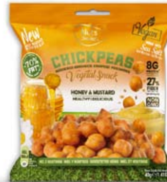
Cod. 300 - SENAPE E MIELE pack da 40g, box da 15pz