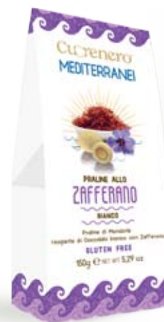
Cod. 177 MANDORLE AL CIOCC. BIANCO E ZAFFERANO astuccio da 150g, box da 10 astucci