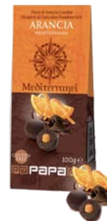
Cod. 227 FILETTI DI ARANCIA E FONDENTE astuccio da 100g, box da 8 astucci

It's Chocolate Time! O meglio, Fruit and Chocolate: con i dragées al fondente finissimo, entriamo nel mondo dell'unicum per eccellenza. Con la sorpresa del cioccolato bianco, che ammorbidisce e lascia emergere le note nascoste di un rum giovane e secco.