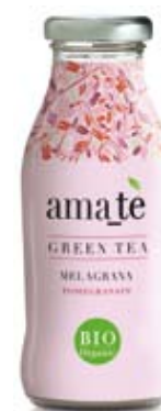
cod. 217V Melagrana