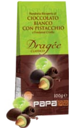
Cod. 233 MANDORLA E CIOCC. BIANCO AL PISTACCHIO astuccio da 100g, box da 8 astucci