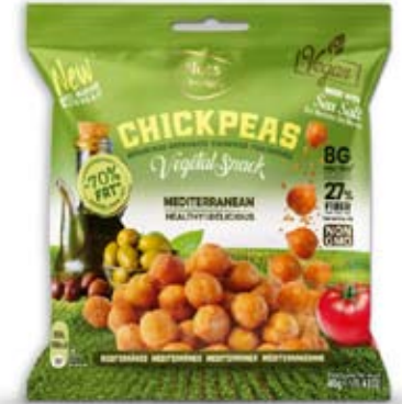
Cod. 301.M - OLIVE pack da 40g, box da 15pz