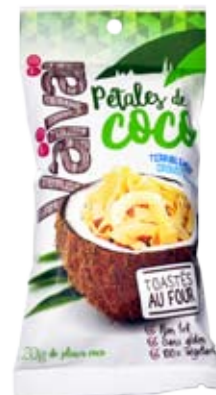
Cod. 279 PETALI DI COCCO TOSTATI AL NATURALE busta richiudibile da 20g, box da 24 buste