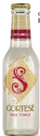
cod. 329 Pura Tonica Botanica