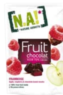
Cod. 204 PEPITE DI LAMPONE AL FONDENTE bustina richiudibile da 35g, box da 30