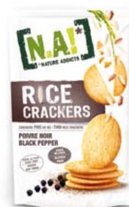
Cod. 221 PEPE NERO, pack da 70g, box da 12pz