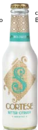
cod. 327 Bitter Citrusy