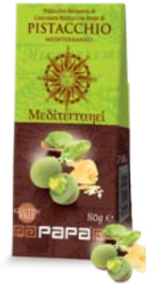
Cod. 226 PISTACCHI E CIOCC. BIANCO AL PISTACCHIO astuccio da 80g, box da 8 astucci