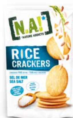
Cod. 219 SALE MARINO, pack da 70g, box da 12pz