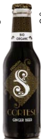
cod. 328 Ginger Beer Biologico