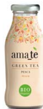
cod. 214V Pesca