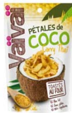
Cod. 258 PETALI DI COCCO TOSTATI AL CURRY busta richiudibile da 40g, box da 12 buste