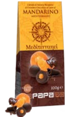
Cod. 225 FILETTI DI ARANCIA E CIOCC. AL MANDARINO astuccio da 100g, box da 8 astucci

Ci sono il Mediterraneo, i caldi venti del Sud e i suoi agrumeti in questi dragées di qualità finissima che abbracciano l'arco armonico dei migliori liquori. E non solo: le stout di malto scuro e tostato offrono sentori di caffè e cacao e si abbinano bene a dessert a base di cioccolato, come confermano le Chocolat Stout, emozionanti birre con addizione di cacao.